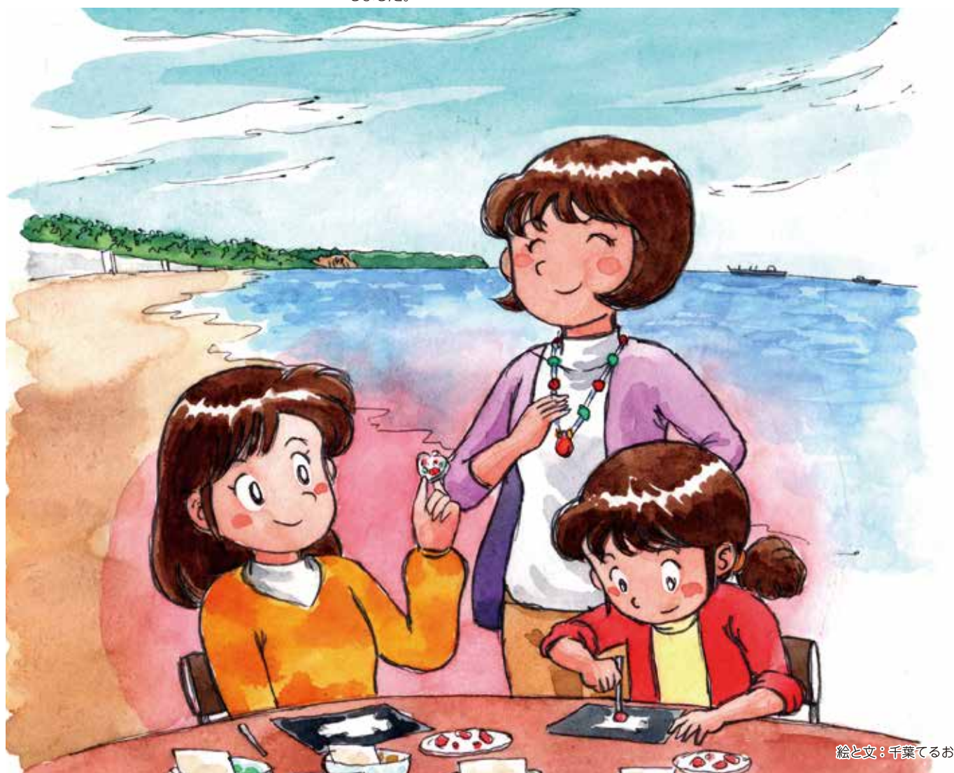
絵と文：千葉てるお